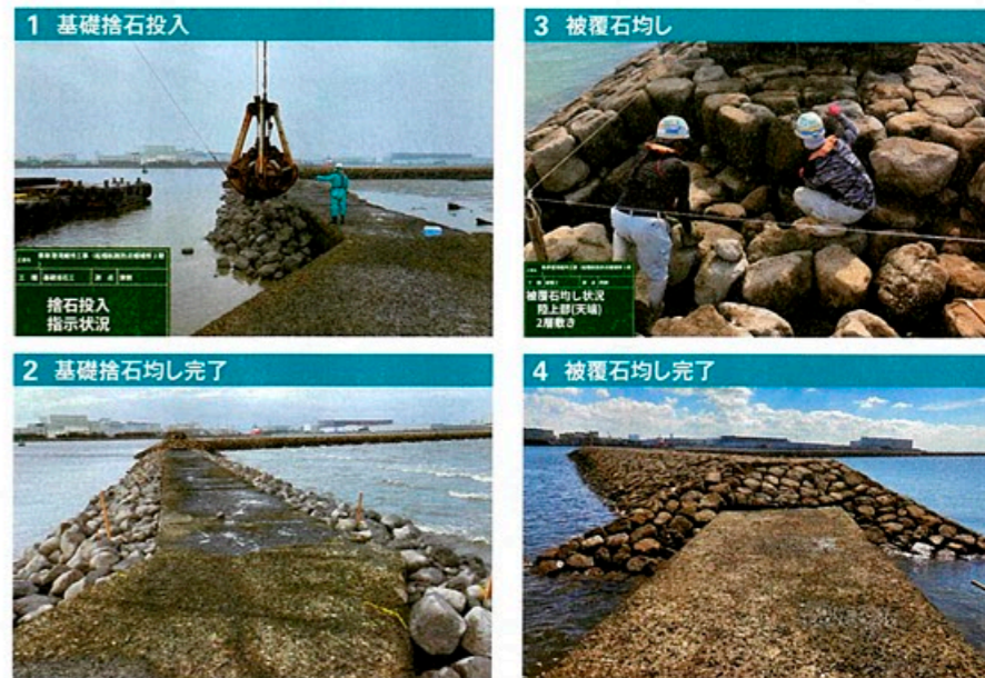
1 基礎捨石投入 基礎捨石の投入指示。基礎捨石の重さは1個当たり100~200kg。作業員が立っている場所が補修工事前の防泥柵。この防泥柵を石積みで台形状に巻き込むことで老朽化した柵の機能回復を図る 2 基礎捨石均し完了 基礎捨石を投入作業と均し作業を終えた段階。基礎捨石を固定するため、この上にさらに被覆石をかぶせていく 3 被覆石の均し作業 被覆石の均し作業を終えた段階。天端高A.P.+3.1mを確保する 4 被覆石均し完了 被覆石の均し作業を終えた段階。天端高A.P.+3.1mを確保する