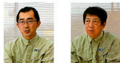
東亜建設工業株式会社 千葉支店