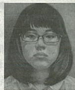
2016年度最優秀賞受賞作品 「柳緑花紅」