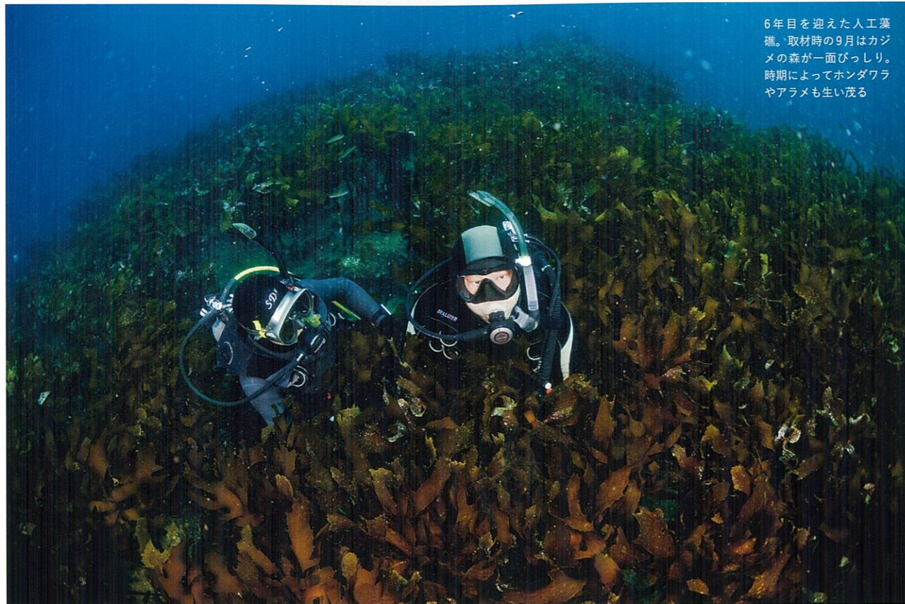
6年目を迎えた人工藻礁。取材時の9月はカジメの森が一面びっしり。時期によってホンダワラやアラメも生い茂る