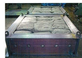
ビバリー®ボックス