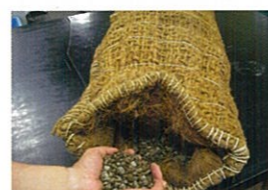
ビバリー®ユニット

自然界では落ち葉などが酸酵して出来る腐葉土に二価鉄が結び付いた「腐植酸鉄」が、川から海へと流れ出て海藻の養分になる。新日鐵住金が開発したビバリー®シリーズは、藻場造成用の鉄鋼スラグ製品たちである。「ビバリー®ユニット」は、森から海へ供給される腐植酸鉄を、鉄鋼スラグと人工腐葉土をミックスすることにより生成するもの。海藻の着生基質となる「ビバリー®ロック」は、鉄鋼スラグから製造する人工の石で、天然石を採掘することなく藻場の造成を可能とする自然に優しい製品。香岐島・石田地区の人工藻礁は、海底に一辺12m四方、高さ1mの台形状に「ビバリー®ロック」を積み上げ、その中心にビバリー®ユニットの詰まった「ビバリー®ボックス」を配置。これを計5か所の海底に設置したところ、4か月後から海藻が芽吹き始め、6年経った今もカジメやアラメ、ホンダワラといった多様な海藻類が毎年見事な成長を見せている。