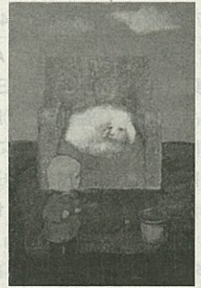
第40回金賞「あすなろ」油彩M30号(則武保弘)