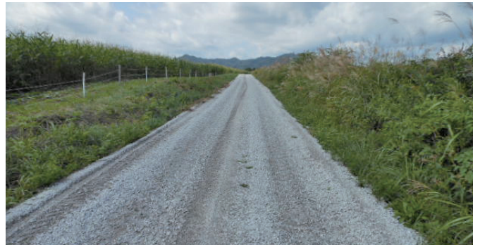
寒冷地道路ぬかるみ対策 (農業用道路)