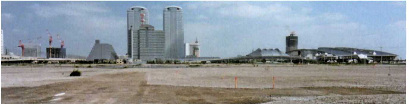
臨時駐車場 (千葉市:幕張メッセ)