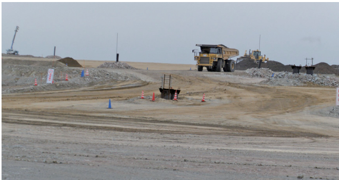
大型車両走行仮設道路 (羽田空港)