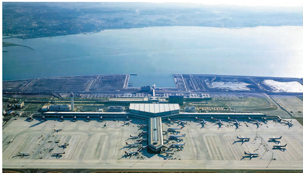
中部国際空港（愛知県）

代替物としてではなく、その優れた特性を活かした付加価値の高い工業製品として、より一層の品質向上、利用技術の開発、製品の安定供給に努めてきた。鉄鋼スラグは、こうして100年にわたり培ってきた技術と信頼によって、セメント用材や道路用材、土木工事、港湾工事用材、コンクリート用骨材など幅広い用途に使用されるようになり、社会基盤充実の一翼を担っている。さらに、全鉄鋼スラグ生成量の99%が資源化された現在でも、社会環境の変化に対応すべく新たな利用技術開発や製造技術の改善に邁進している。