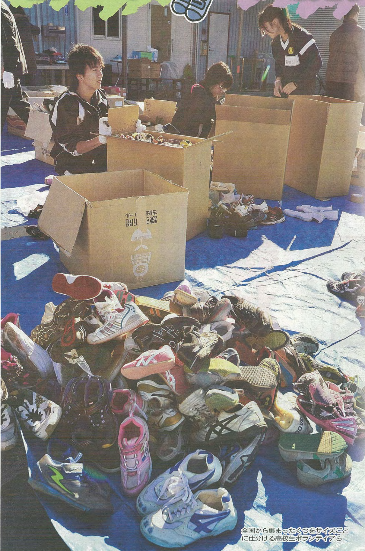
全国から集まったくつをサイズごとに仕分ける高校生ボランティアら