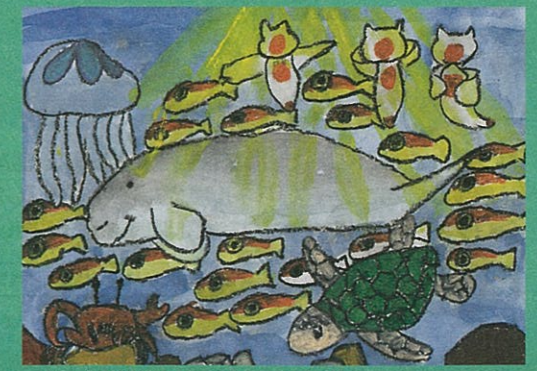
だい 6回最優秀賞(子供の部) 作品