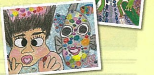
だい 5回最優秀賞 こども が さくひん (子供の部) 作品