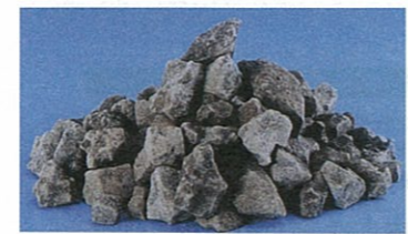
はがね せいせん 鋼に精錬されるときに発生する「製鋼スラグ」 てっこう 鉄鋼スラグは2種類ある

みなさんは「鉄鋼スラグ」という言葉を、聞いたことがありませんか？それは、鉄をつくる過程で生産される副産物のこと。実は鉄鋼スラグをもとにつくられた製品は、セメント原料やコンクリート用骨材、道路の路盤材やアスファルトに用いられるなど、私たちの身近なところで活用されています。肥料成分も含まれていることから、農作物用肥料といった