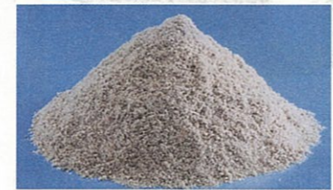
こうろ てっこうせき と 高炉で鉄鉱石を溶かして かんげん ほっせい 還元するときに発生する「高炉スラグ」

鉄鋼スラグ協会 TEL.03-5643-6016 〒103-0025 東京都中央区日本橋茅場町3-2-10 鉄鋼会館5階