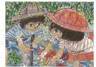
だい 2回最優秀賞(子供の部) 作品

スラグ製品と海と森」と題したアートコンテストを開催しています。誰でも気軽に参加できるコンテストです。まずは鉄鋼スラグ協会のウェブサイトで、鉄鋼スラグ製品のことを少しだけ勉強してください。そのうえで海や山や川や森、そして私たちが暮らす町や都会を舞台に、たくさんの生命が輝き、共存している様子を表現してください。みなさんの力作を、お待ちしております。