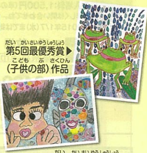
▲第5回最優秀賞(子供の部)作品 ▲第4回最優秀賞(子供の部)作品