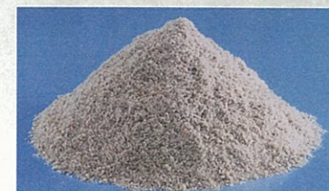
高炉で鉄鉱石を溶かして還元するとき発生する「高炉スラグ」

お問い合わせ 鉄鋼スラグ協会 TEL.03-5643-6016 〒103-0025 東京都中央区日本橋茅場町3-2-10 鉄鋼会館5階