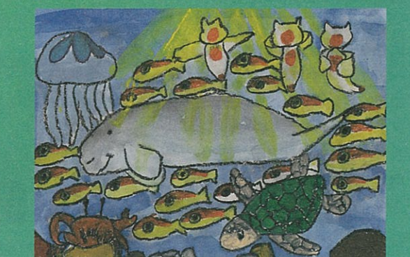
▲第6回最優秀賞(子供の部)作品