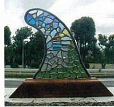
ドラゴンPINKさん/東京