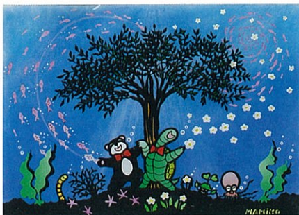
[大人の部] 最優秀賞作品

鉄を製造する際に出る副産物「鉄鋼スラグ」をもとに作られた製品が、コンパやサンゴの再生に劇的な効果を発揮しているってご存知ですか? 今年で第7回を迎える「鉄鋼スラグ製品と海と森」アートコンテストは、鉄鋼スラグ製品への理解を深めてもらおうと実施されているもの。今年も来年1月31日まで作品を募集しています。まずは、鉄鋼スラグ協会のHP ( http://www.slg.jp/ ) で鉄鋼スラグ製品のことを少しでも勉強してください。そのうえで、海と森と生命のつながりを、あなたならではの感性で表現してみよう! 最優秀賞(大人の部)の賞金はなんと10万円! 詳細はHPをチェック。