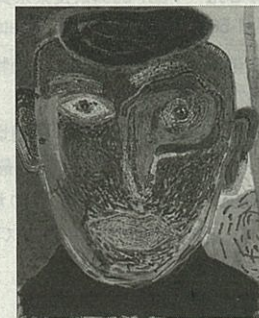
第27回大賞「誕生日」(タナベススムエ)