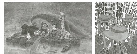
昨年のお最優秀作品 大人の部: 徳永奈保さん(左)、子どもの部: 大川心暖さん(右)

ている。また、鉄鋼スラグを用いて作られたコンクリートは、天然素材や普通コンクリートに比べ、鉄やケイ素など、生物に必須な元素を多く含むため、これを魚礁などとして海中に沈めると、海藻やサンゴなどの成長にも有効だ。そんな活用範囲が幅広い鉄鋼スラグ製品のことをより多くの人に知ってもらおうと、鉄鋼スラグ協会は、今回で6回目となる「鉄鋼スラグ製品と海と森」アートコンテストを開催、作品を募集。応募作品に求められるのは、鉄鋼スラグ製品のことを少しでも勉強し、その上で海や山、川や森、そして今暮らしている町や都会を舞台に、たくさんの生命が輝き、共存している様子を表現すること。絵画、イラスト、写真(プリント)のいずれかの方法で、誰でも応募できる。鉄鋼スラグの知識を身につけつつ、身近な環境をアート作品として表現してみたいかがだろうか。