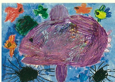
優秀賞 「こぶだいとうにとさかな」 海老澤 結 (4歳/神奈川県)