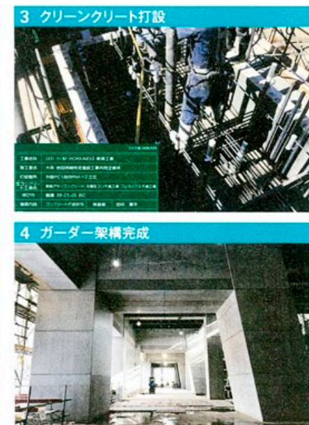
1 外殻PCa設置① 2 外殻PCa設置② 3 クリーンクリート打設 4 ガーダー架構完成

1 2 ガーダー架構には外殻プレキャストコンクリート(PCa)を採用した。そのサイズは、2.5×4×1.8m 3 外殻PCaを1段ずつ重ねて内部にクリーンクリートを打ち込む作業を、3日サイクルで繰り返す 4 クリーンクリートの特性上、凝結・硬化が遅れる心配があったものの、型枠不要の外殻PCaと組み合わせることで、作業性や工程上の影響を最小限に抑えた